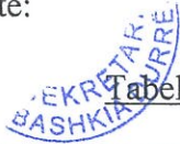
Tabelë 2. Nivelet e tatimit të thjeshtuar mbi fitimin për biznesin e vogël

Niveli i tatimit: Nivelet e tatimit të thjeshtuar mbi fitimin për biznesin e vogël paraqiten si më poshtë: