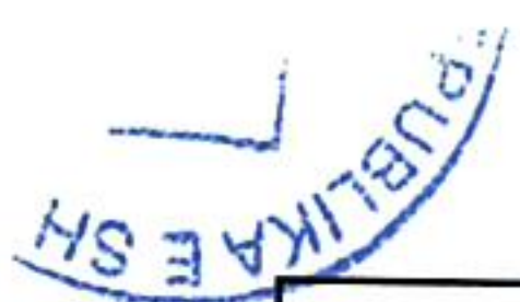
TABELA PËRMBLEDHËSE PËR BANORËT E DËMTUAR QË PËRFITOJNË NGA FONDI I EMERGJENCAVE CIVILE