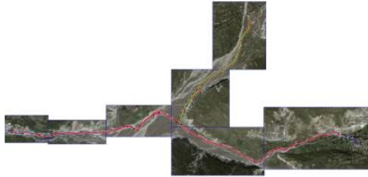
Horografia e zones se rievuar